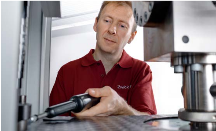
Opérations d'alignement dans le cadre d'un étalonnage