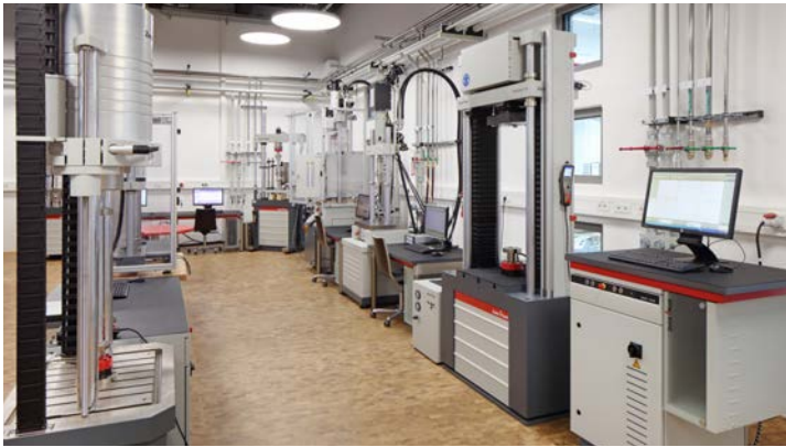
Laboratoire d'essai pour des essais de résistance à la fatigue