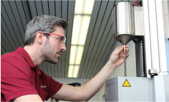
Large éventail de prestations d'étalonnage