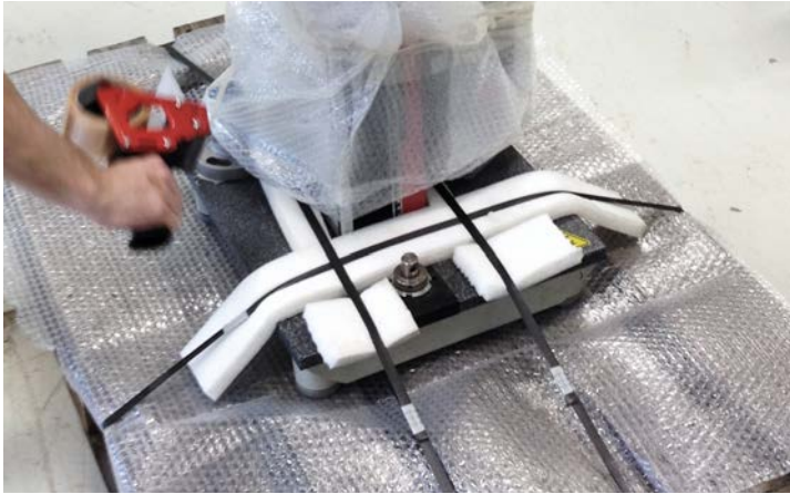
Préparation professionnelle du transport