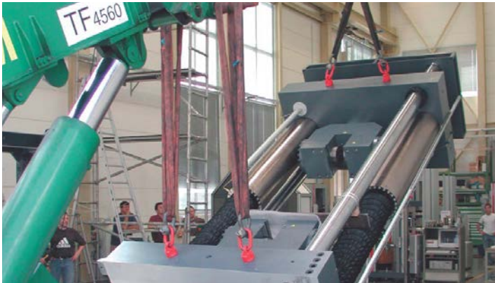
Transport et déménagement appropriés