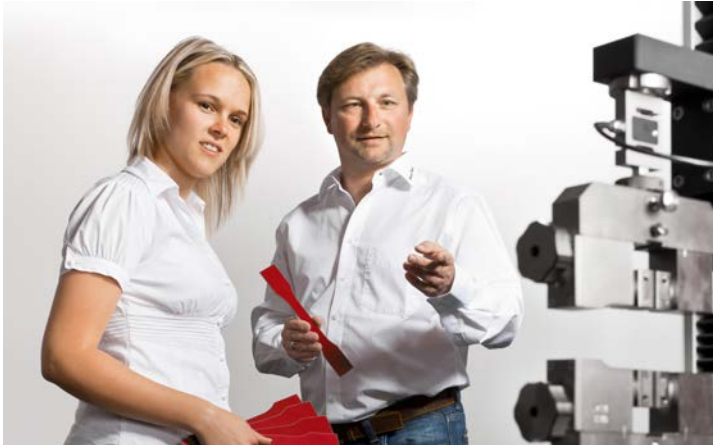
Conseil en matière de méthodes d'essai et d'exécution des essais